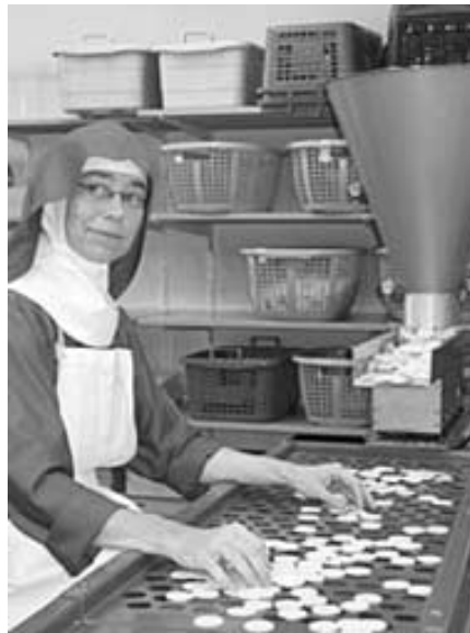
Die Hostien werden von Hand sortiert und abgepackt.

Hostien, die in der Peiner Pfarrkirche ausgeteilt werden, stammen aus der Hostienbäckerei der Benediktinerinnen-Abtei Varense in der Nähe von Gütersloh. Dort werden sie in mehreren Arbeitsgängen nach strengen Vorschriften hergestellt und mit der Post verschickt.